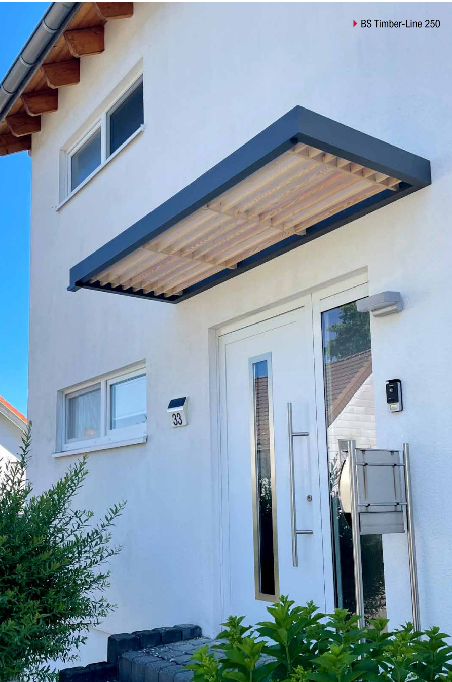
► BS Timber-Line 250